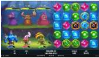
Svět Dark Forest