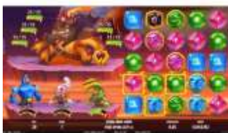
Souboj s bossem

Na válce se náhodně umístí 2 až 4 symboly Random Wild. Pokud se symboly Random Wild stanou součástí nějaké výhry, vybuchnou společně s ostatními symboly. Nové symboly, které se ocitnou na pozicích dříve zničených symbolů Random Wild, se přemění na symboly Wild.