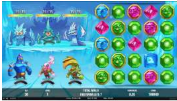
Svět Ice World