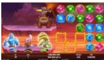
Funkce Random Wilds