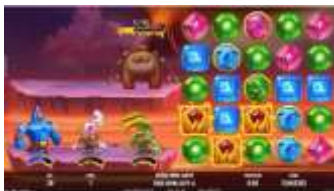
Svět Fire Lands s funkcí Random Wilds