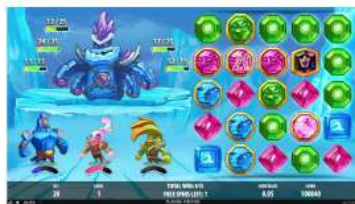
Souboj s bossem

Po následujícím spuštění funkce Avalanche™ se na válce náhodně umístí sada 2 symbolů Heavy Wild. Symboly Heavy Wild se nemohou objevit níže než na 4. řádku. Symboly Heavy Wild se mohou objevit i na jiných symbolech Heavy Wild. V takovém případě se však na válce umístí pouze 1 symbol Heavy Wild.