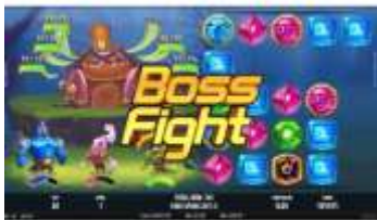
Souboj s bossem

Na válce se náhodně umístí symbol Spreading Wild. Pokud se symbol Spreading Wild stane součástí nějaké výhry, vybuchne společně s ostatními symboly. Na pozicích sousedících s původním zničeným symbolem Spreading Wild se následně vytvoří nové symboly Spreading Wild. Každý symbol Spreading Wild může vytvořit až 2 symboly Spreading Wild.