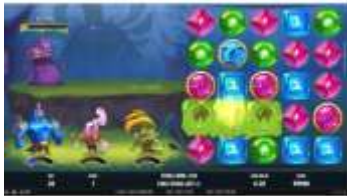
Symboly Spreading Wild