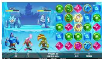
Funkce Heavy Wilds